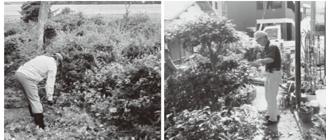
庭の作業を行う協会員

住民参加型在宅福祉サービス。生活上の困りごとを有償制のボランティアで解決するサービス。(R4実績 252件)